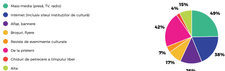
Ponderea surselor de informare despre spectacole

Ca o consecință firească a gradului de utilizare a internetului, acesta se apropie ca procent (în ceea ce privește sursele de informare) de Mass-media (presă, tv, radio).